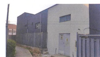
Vedere EST - post trafo existent