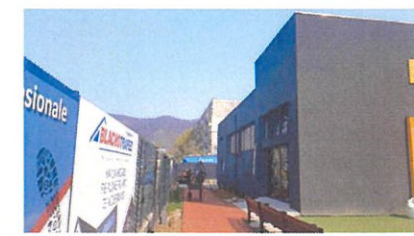
Vedere VEST - existent