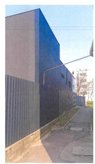
Vedere EST - existent