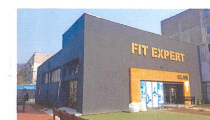
Vedere SUD-VEST- existent