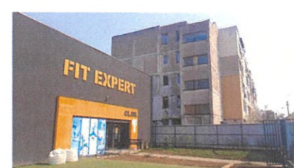
Vedere SUD - existent